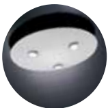
bombai 04 1310

At the end of each series and with each reference, you will find the technical and basic information you should require.