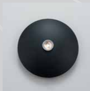
084 NEGRO TEXTURIZADO TEXTURED BLACK