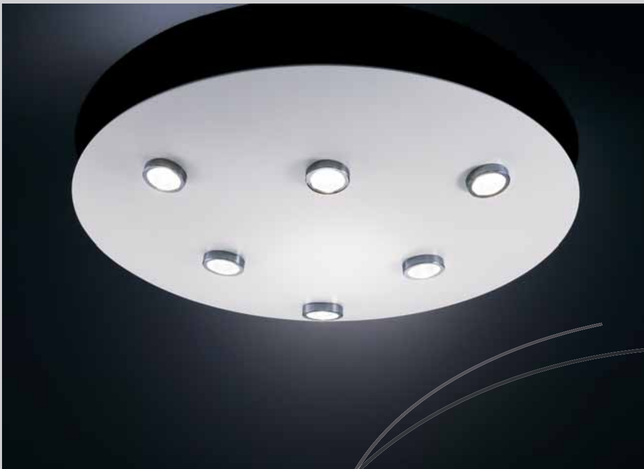
Plafon 6l / 6l Ceiling Light

001-1310/6-- LED 230V / 500 mA / 6 x 4.6W INCLUIDA / INCLUDED