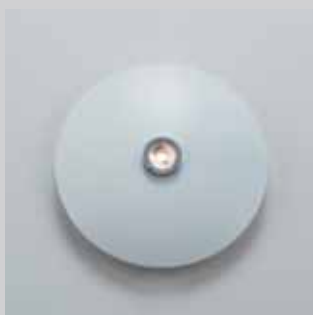
080 BLANCO TEXTURIZADO TEXTURED WHITE