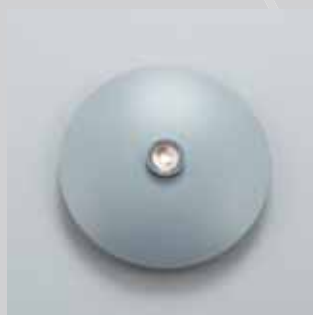
081 GRISO NATURA NATURE GREY